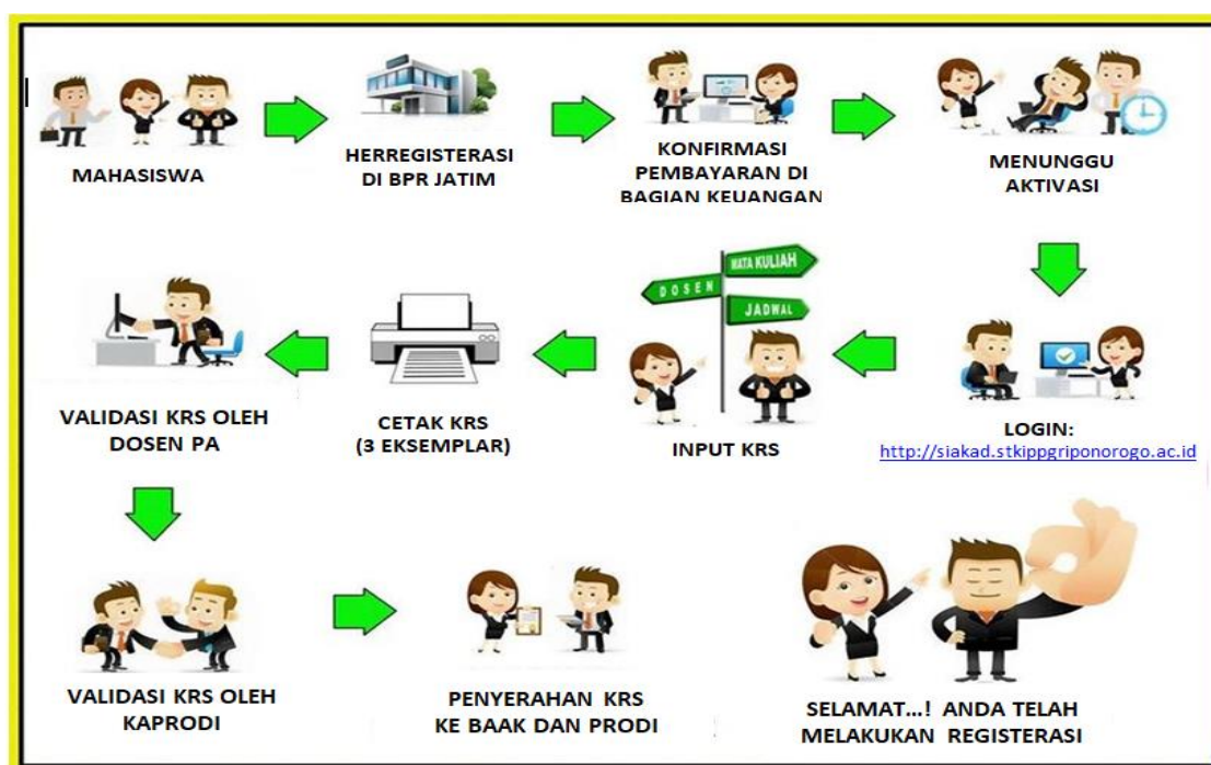
Bagan 2.1: Diagram alur pengisian KRS online

Alur pengisian kartu rencana studi (KRS) online dapat dilihat pada diagram berikut: